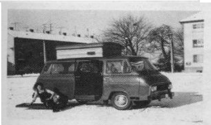
obr. 1.12. obytný automobil Š 1203 CAMP