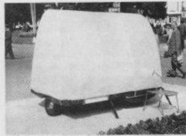
obr. 1.8. Prototyp skládacího přívěsu OPP Vyškov