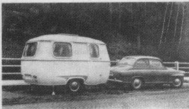
obr. 1.5. První československý přívěs Karosa W4