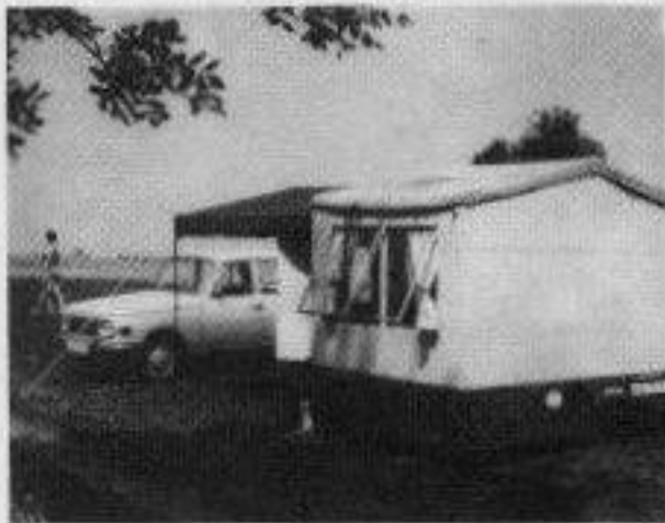
obr. 1.9. prototyp skl. přívěsu Rekreatant