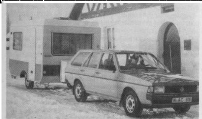
obr. 1.17. Obytný přívěs Bastei (NDR)