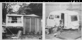
obr. 1.15. Prototypy maďarského prívozu obr. 1.16. Polský prívoz N.122