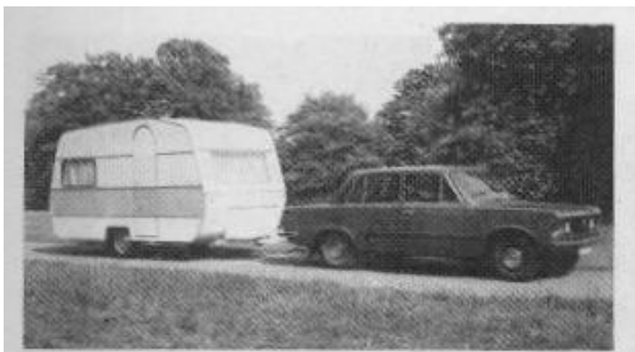
obr. 1.11. obytný přívěs Astra 360

Napsal uživatel Rudolf Reithaller Pondělí, 27 Prosinec 2010 16:10