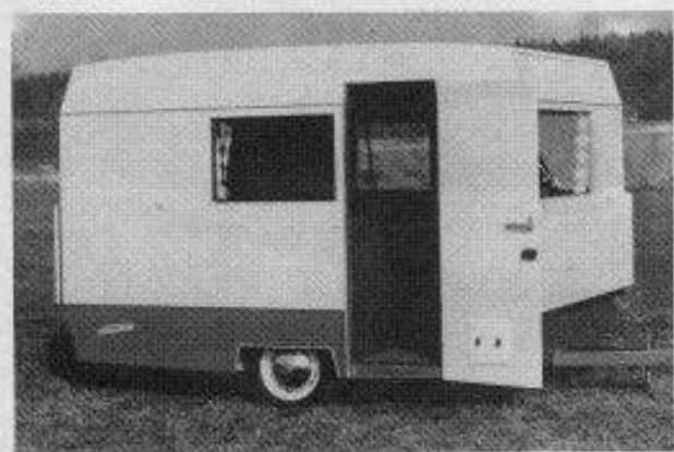
obr. 1.6. prototyp přívěsu Karosa Racek 300