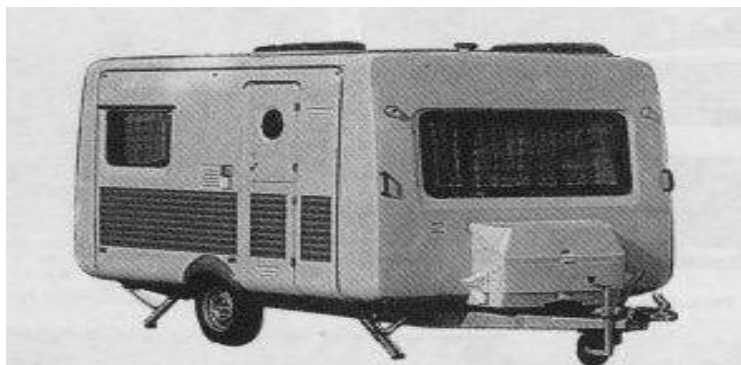
obr. 1.18. obytný přívěs intercamping ( NDR )

Napsal uživatel Rudolf Reithaller Pondělí, 27. Prosince 2010 16:10