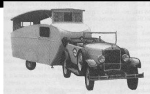
obr. 1.4. První obtočený přívěs firmy Dečlánský z roku 1931