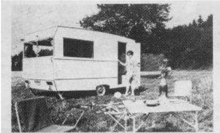
obr. 1.7. Karosa Racek 400

Napsal uživatel Rudolf Reithaller Pondělí, 27 Prosinec 2010 16:10